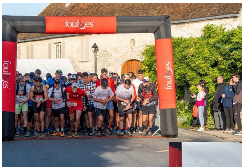
Départ des courses adultes & juniors

Nous vous attendons, chacun est le bienvenu, coureur « plaisir », plus aguerri, ou bénévole !